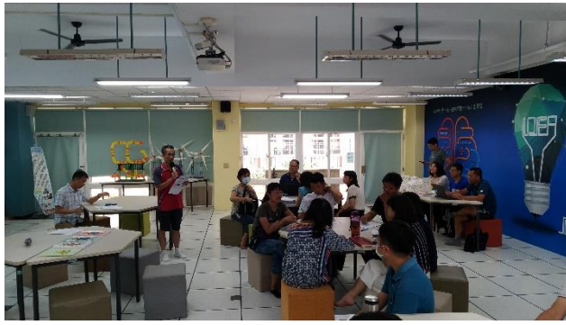
社會領域發表意見