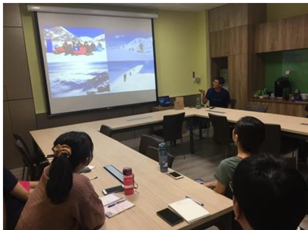
社群老師專心聆聽