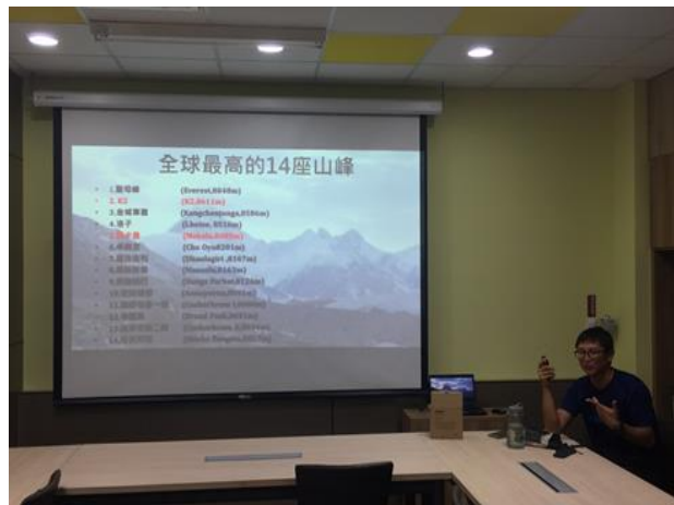
全球最高的十四座山峰