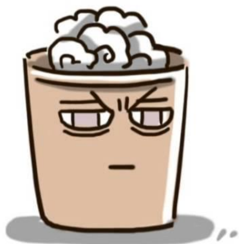
垃圾桶 Trash bin