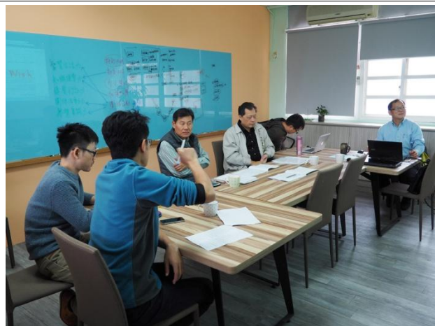
翁宗毅老師建議程式設計由大學端協助提供