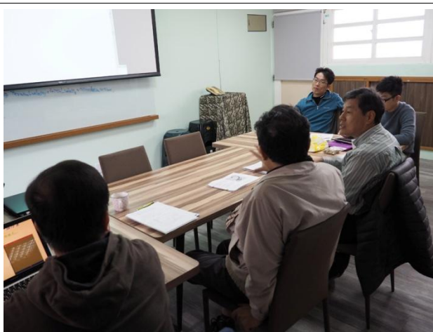
振龍秘書提出經費於每月開會時 提出月報管控