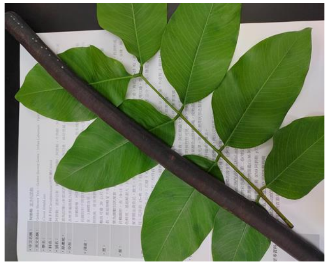
手作葉拓課程材料-1