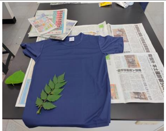
社群老師實作體驗-2