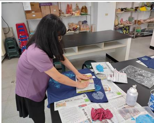
社群老師實作體驗-1