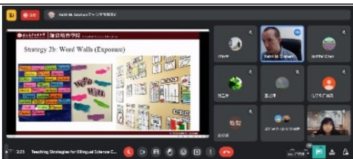
3. 教學input的策略word wall