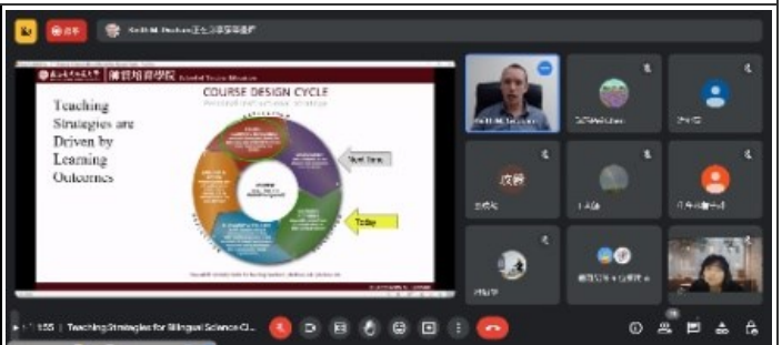
2. 講師指出今日目標在統整圖中的位置