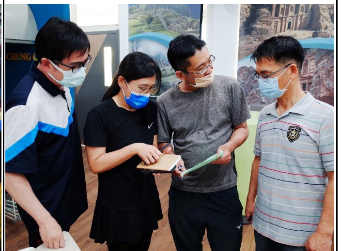
與會老師研習後共同討論