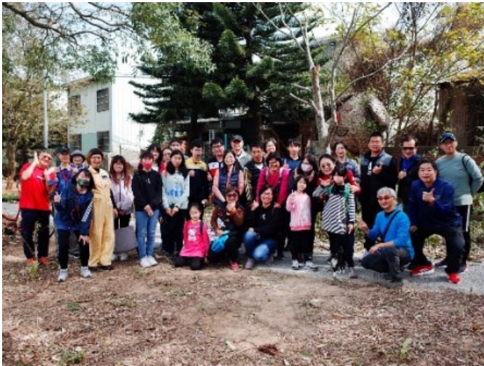
1. 上午環境教育參與成員合影