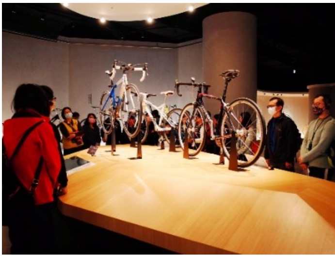
5. 下午參訪並進行館內導覽