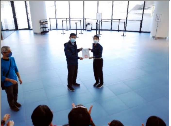
4. 本校校長頒發感謝狀給探索館館方